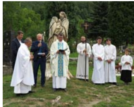
Vysvätenie sochy Sv. rodiny