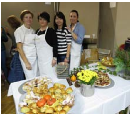
Riečanské súťažné družstvo