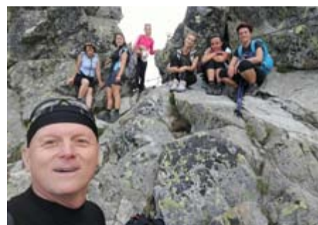
Prechod cez Bystrú lávku 2300 m.jpg