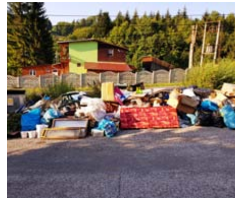
Kontajnery v Nevoľnom

efektívnejší. Uzavreté vrecia sa zbierajú vždy v určených termínoch pred rodinných domov, resp. v zimných mesiacoch je ich potrebné priblížiť na vhodné prístupné miesto. Percento separácie v obci za rok 2018 bolo 33,6%, čo ovplyvnilo aj cenu na skládke, za ktorú likvidujeme pevný domový odpad. Chceme Vás požiadať, aby sme sa spoločne snažili triediť čo najviac a tým dosiahneme, že za pevný domový odpad budeme platiť menej. V roku 2020 sa poplatok za komunálny odpad nebude zvyšovať.