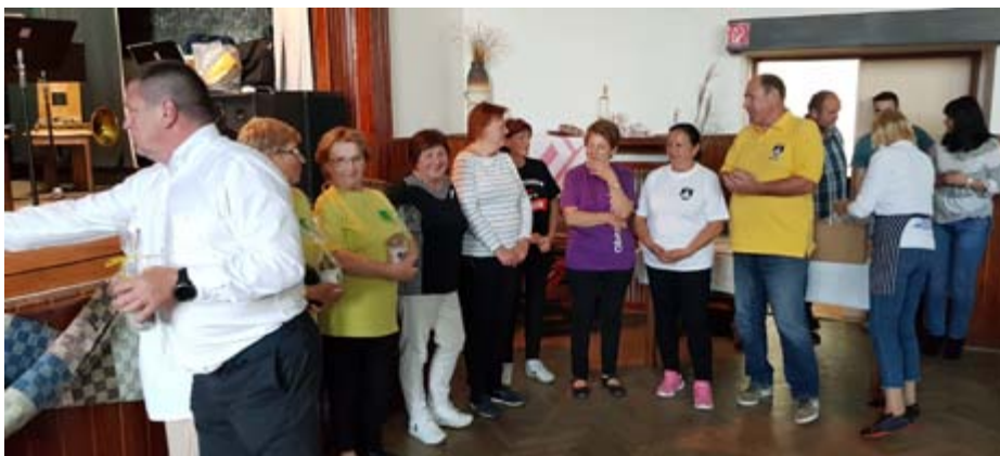
Varenie štiarcu na Králikoch