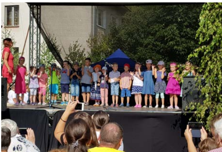
Vystúpenie deti MŠ