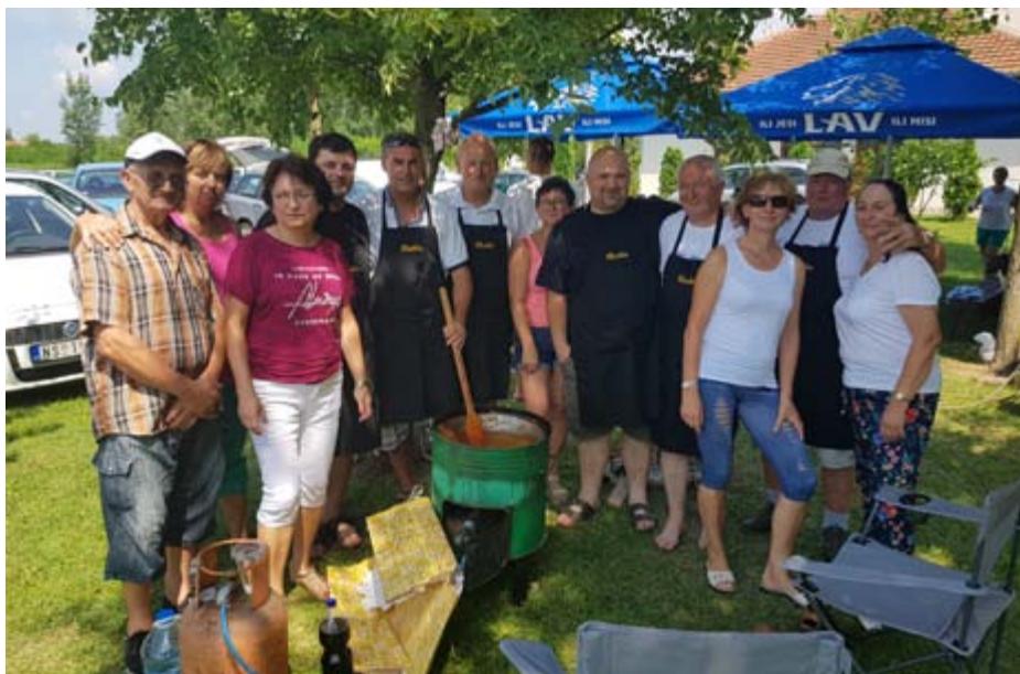
Zástupcovia Riečky v Kulpine