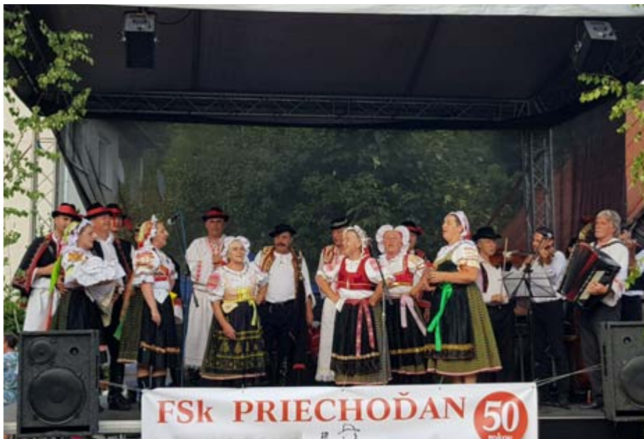
Hostina FS Priechoďan