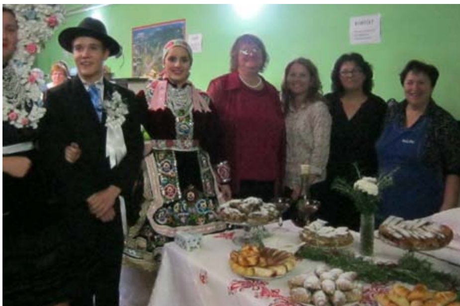
Súťažné družstvo z Kulpina