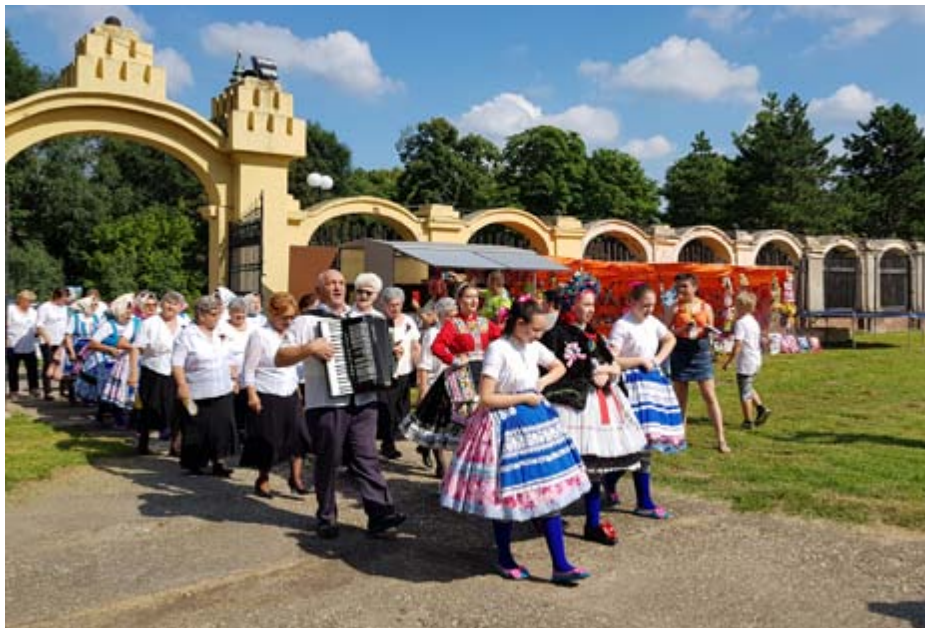
Svadba v Kulpine