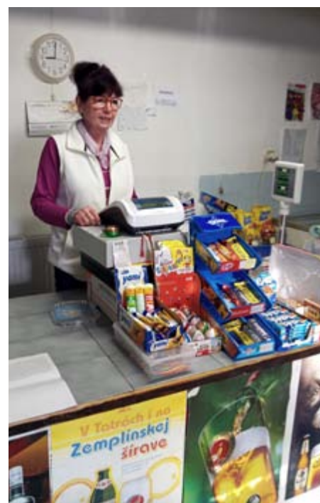
Riečanská žena za pultom