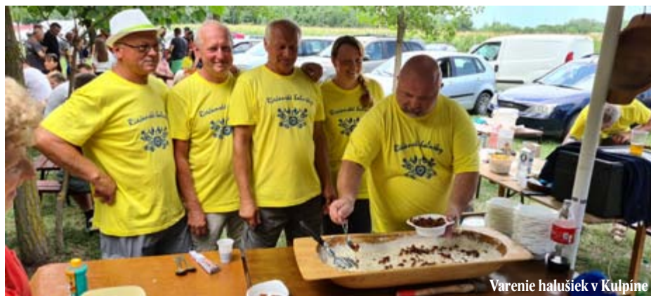
Varenie halušiek v Kulpíne

Aj tento rok v súvislosti s pandemickou situáciou prišiel Mikuláš do našej dedinky netradične. Balíčky porozdával Mikuláš deťom cestou po dedine z horného konca až dolu do „mlyna“. Nedočkávané detičky vyzerali Mikuláša so svojimi rodičmi pred svojimi domami. Viaceré z nich nešetrili básničkami, alebo pesničkou na tému – Mikuláš. Samozrejme neobišiel ani deti v časti Riečka – Nevoľné. Ďakujeme Mikulášovi a dúfame, že o rok sa stretneme na spoločnej oslave.